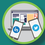
PROJECTEN & SOCIAL MEDIA