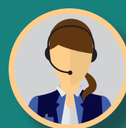
SECRETARIAAT & BACKOFFICE