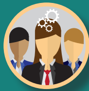
BIJEENKOMSTEN & KENNISOVERDRACHT