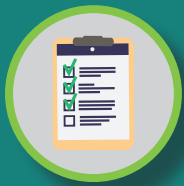
KORTE TERUGBLIK 2016